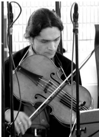
DMITRY BADIAROV PLAYING THE VIOLONCELLO DA SPALLA